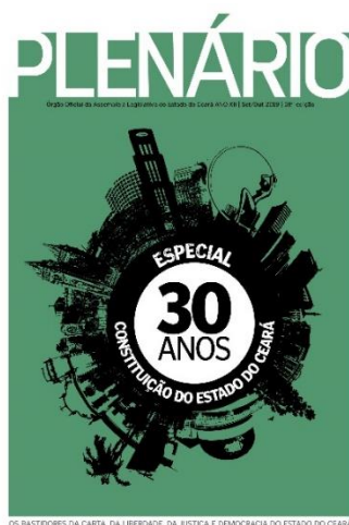
Imagem 4 – Capa da edição 58 – 30 anos da Constituição do Ceará