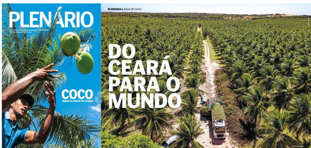
Imagem 5 - Capa da edição 57 com matéria de destaque dos cocos

Em resumo, o projeto foi finalizado com sucesso e marcou o poder legislativo. Para constar, as revistas produzidas nesse período de 2019, foram marcadas por muita produção de audiovisual através do mecanismo de QRcode e uso de drone, pequeno dispositivo voador controlado a longas distâncias e que é utilizado para captar imagens aéreas. Mecanismo usado pela primeira vez na revista na edição 57ª sobre as plantações de cocos no litoral oeste, no município de Paraipaba, marcados por recordes de exportação. Confira a imagem 5: