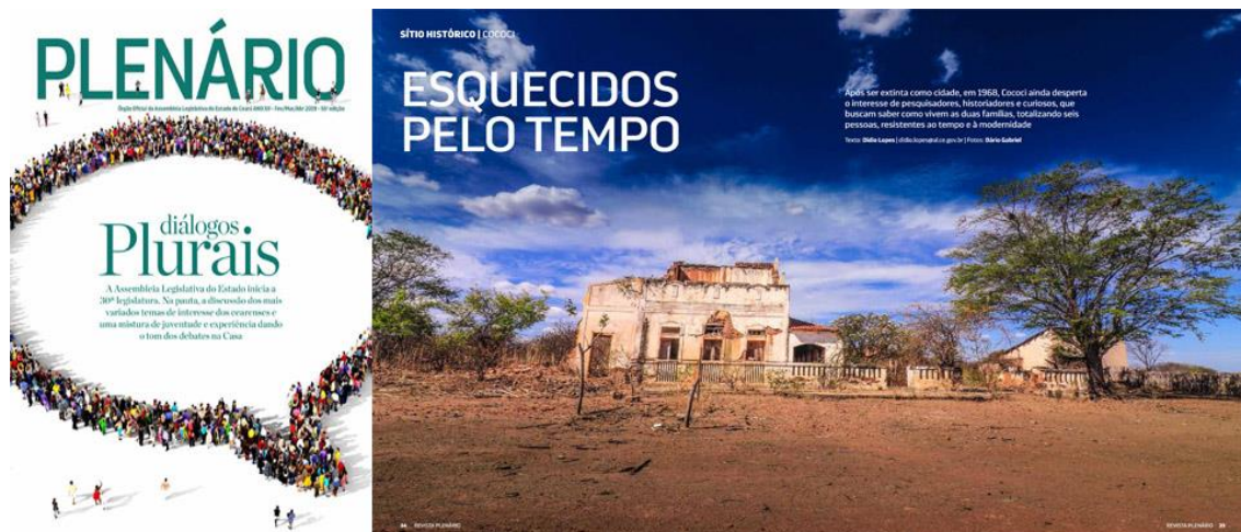
Imagem 3 – Capa da edição 55 com matéria de Cococi: cidade-fantasma do Ceará

relevantes. Para abertura dos trabalhos legislativos, em 2019, a pauta de Cococi iria ser a capa, mas o gestor de comunicação optou por comprar material de um banco de imagens e utilizar apenas tipografia para ilustrar a Revista Plenário. Confira a imagem 3 abaixo: